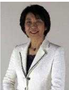
みなさんの知恵と時間を出し合って、ボランティアルームを活性化させたいですね。

内灘町の財産は「人」です。障害のある人となない人の交流イベント「サンタをさがせ！」は、140人がボランティアをされました。この潜在力をもっと発掘するために、専任の調整役「コーディネーター」を。必ずや投資効果の高いものです。地域に帰って来る団塊の世代のやる気を逃さない取り組みを。